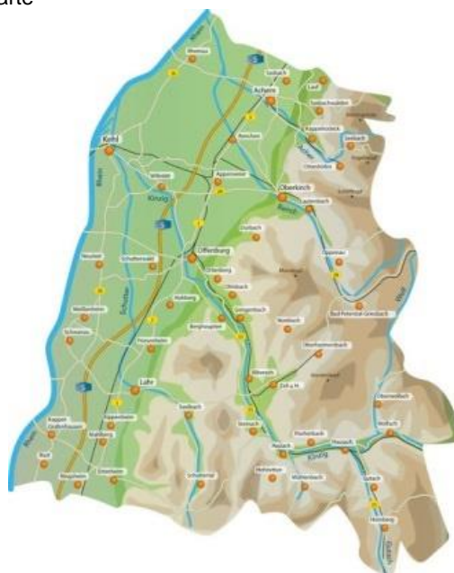
Abbildung 2: Topographische Karte

Die Fläche des RDB beträgt 1.860 km 2 . Der Ortenaukreis ist knapp 60 Kilometer lang, über 30 Kilometer breit und reicht vom Rhein bis in den Schwarzwald. Der höchste Berg ist die Hornisgrinde mit 1.164 Metern. Der tiefste Punkt ist Rheinau mit 124,3 Metern. Die Hauptgewässer im Rettungsdienstbereich sind der Rhein und die Kinzig.