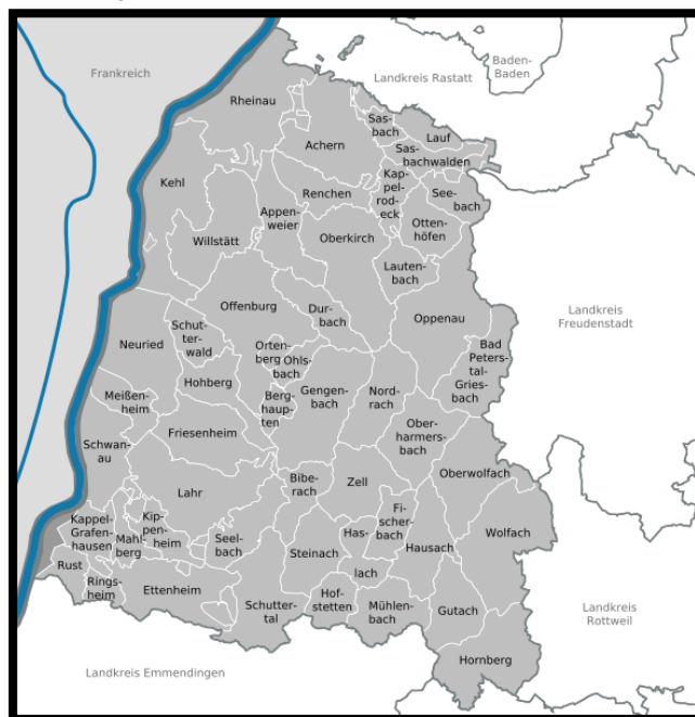
Abbildung 1: Gemeinden im Rettungsdienstbereich

Der Rettungsdienstbereich ist deckungsgleich mit dem Gebiet des Landkreises Ortenaukreis nach § 6 Landkreisordnung.